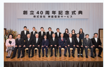
▲創立40周年役職員一同