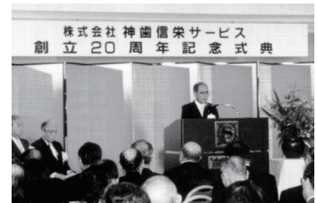
▲創立20周年記念式典